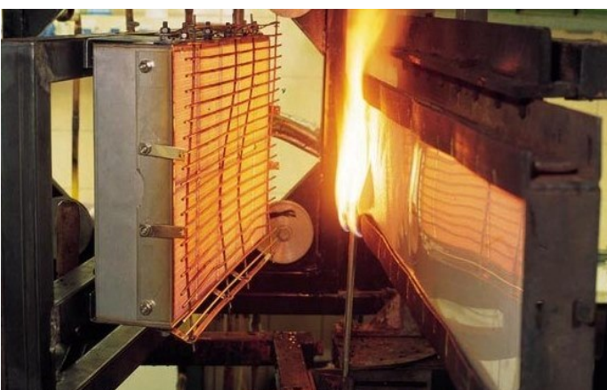
Abbildung 1: Versuchsanordnung Figure 1: Test setup

The critical radiation intensity at which the test specimen is extinguished is determined for classification (see Table 1).